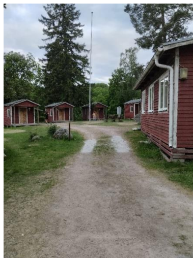
Konferenslokalen t.v. och en vy över delar av stugbyn sett från konferenslokalen.